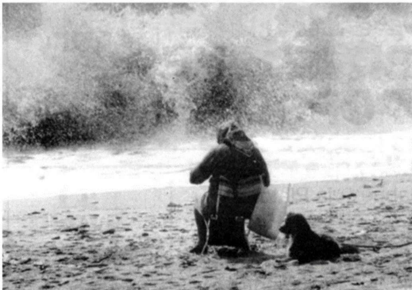
(Concorso fotografico organizzato dalla Biblioteca Comunale di Pioltello nel 1983 "L'inutile sfida")

"Lei di fronte ad un mare che manifesta tutta la sua potenza e irruenza, nulla la smuove, non un sussulto, un cenno, uno sguardo, il mare tra onde minacciose che s'innalzano e si ritirano a riva placa la sua potenza e la rispetta indietreggiando. E anche lui, tranquillo, da lei si sente protetto".