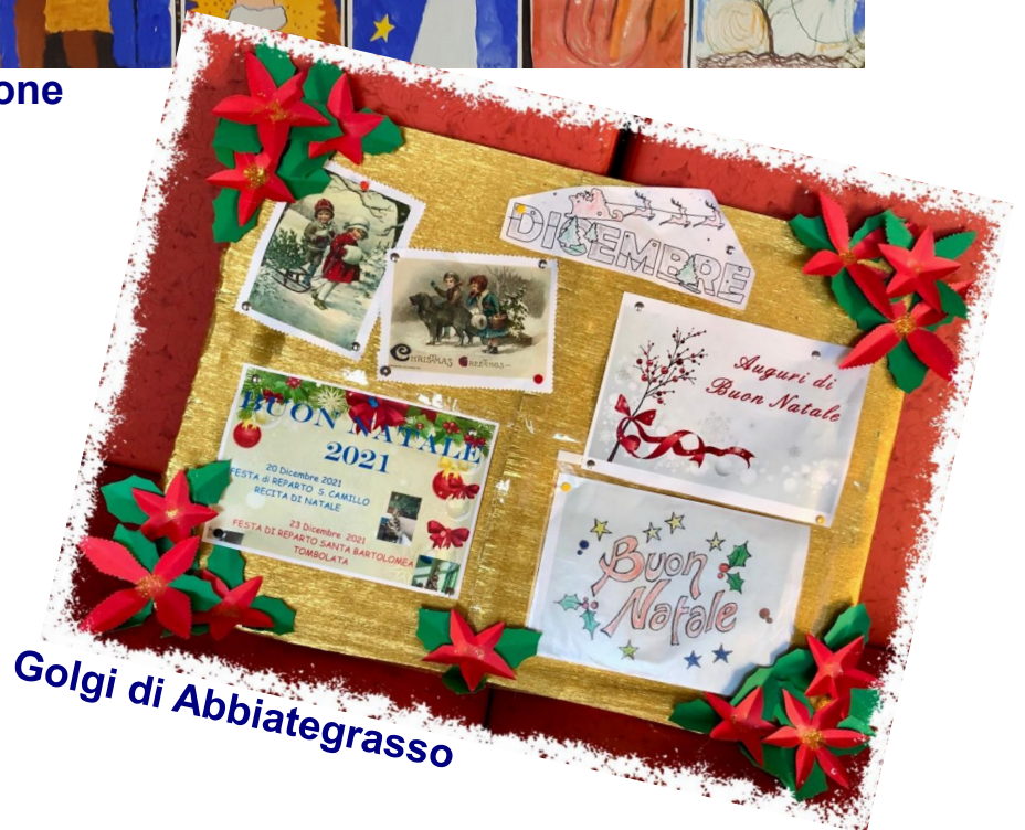
Golgi di Abbiategrasso