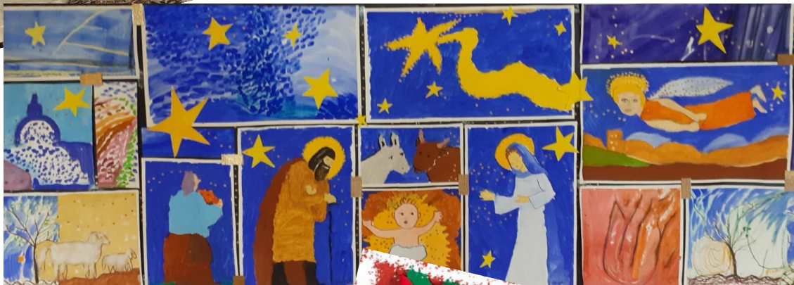
Redaelli di Vimodrone

Tanti auguri per un dolce e rinnovato Natale dai nostri Istituti