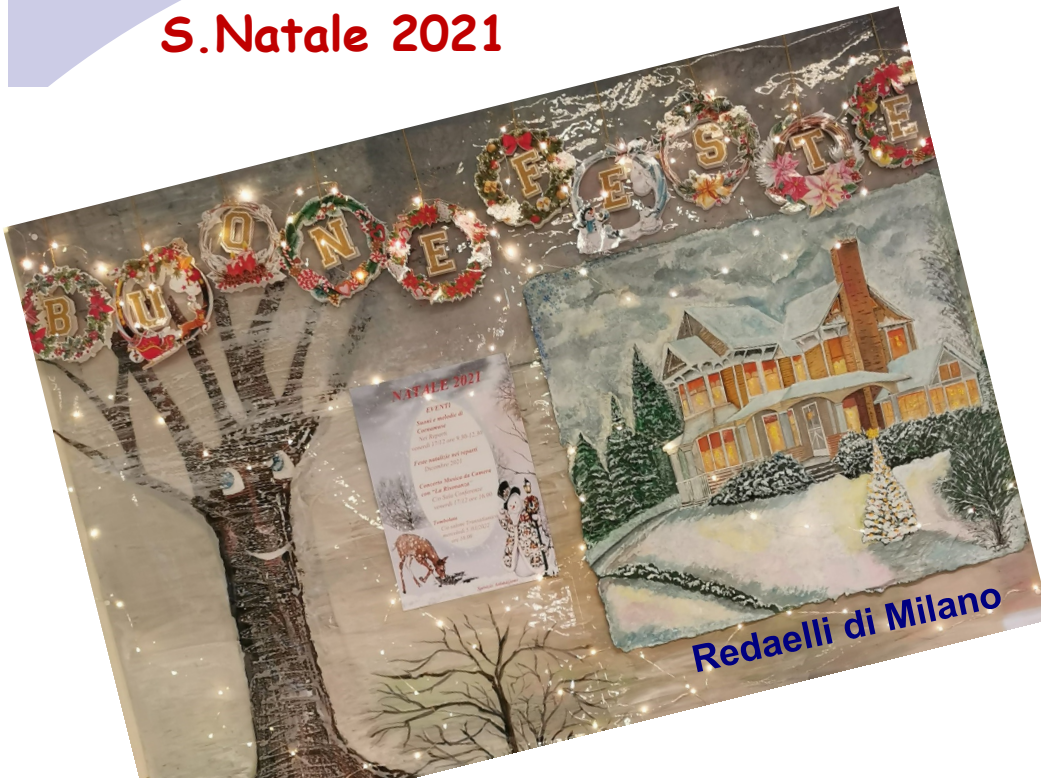
Redaelli di Milano

Tanti auguri per un dolce e rinnovato Natale dai nostri Istituti